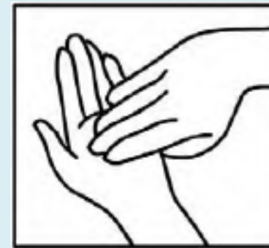
Τις άκρες των δακτύλων