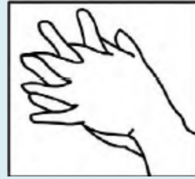
Ανάμεσα στα δάχτυλα