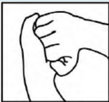
Το πίσω μέρος των δακτύλων