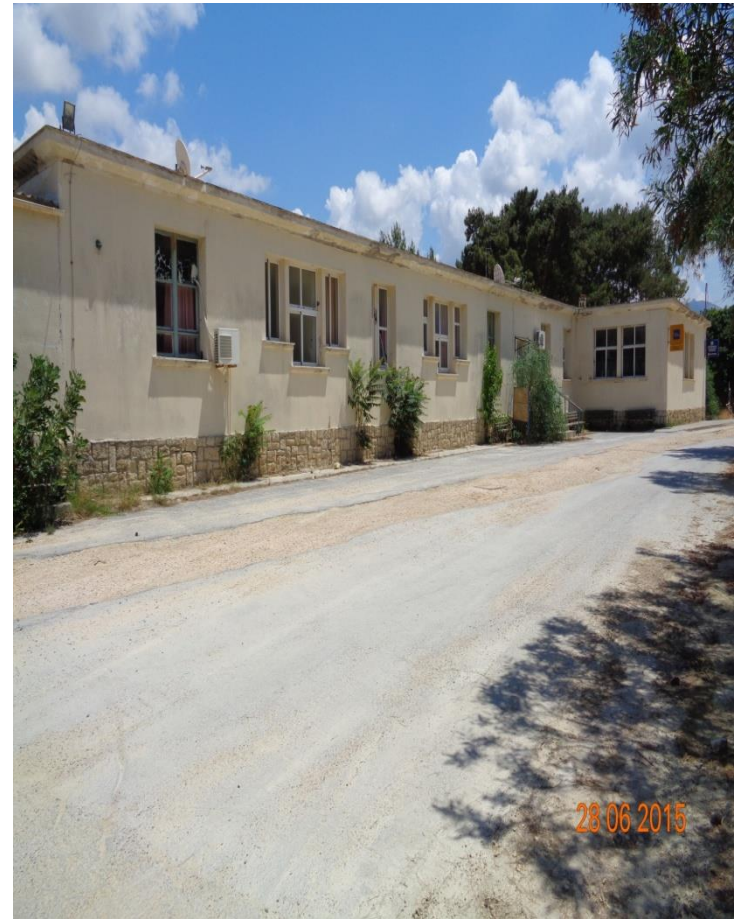
Φωτογραφία: κτίριο όπου στεγαζόταν η Σχολή