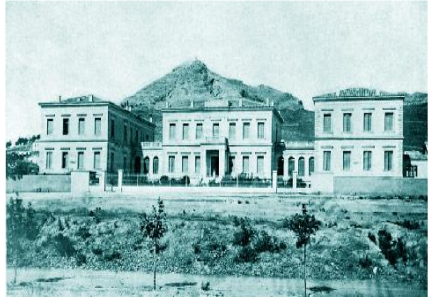
Το Νοσοκομείο κατά το έτος 1884