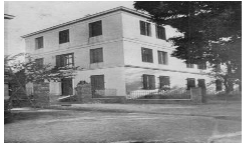
Ο ΟΙΚΟΣ ΑΔΕΛΦΩΝ ΤΟ 1916