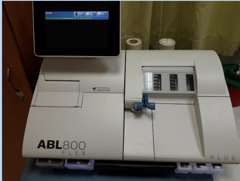
Εικόνα 6 ΑΝΑΛΥΤΗΣ ΑΕΡΙΩΝ ΑΙΜΑΤΟΣ (1)