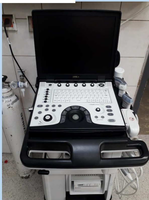
Εικόνα 3, 4 ΜΗΧΑΝΗΜΑ ΥΠΕΡΗΧΩΝ