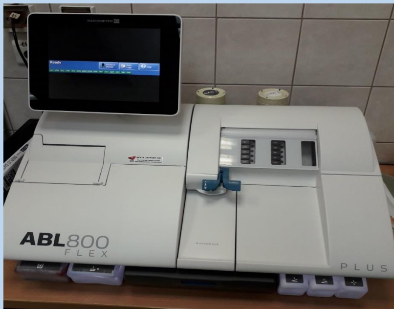
Εικόνα 7 ΑΝΑΛΥΤΗΣ ΑΕΡΙΩΝ ΑΙΜΑΤΟΣ (2)