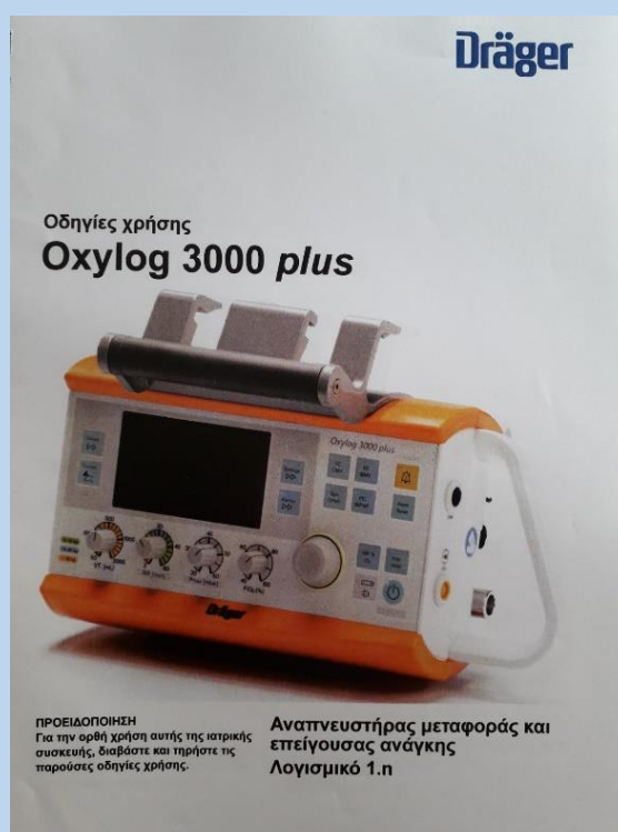
Εικόνα 5 ΑΝΑΠΝΕΥΣΤΗΡΑΣ ΜΕΤΑΦΟΡΑΣ ΚΑΙ ΕΠΕΙΓΟΥΣΑΣ ΑΝΑΓΚΗΣ