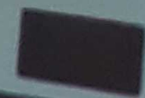
Εικόνα 1: Τα σημεία που διαφεύγουν τελείως της προσοχής απεικονίζονται με κόκκινο χρώμα. Τα σημεία που διαφεύγουν της προσοχής μετρίως απεικονίζονται με μπλε και τα σημεία που δεν διαφεύγουν με μαύρο.